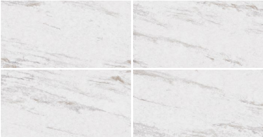
*El color del producto real puede presentar variación al color de la fotografía

CM - Comercial Moderado. Productos para ser utilizados en áreas comerciales con tránsito moderado de personas; en áreas de pisos donde no se presenten elementos abrasivos que deterioren la superficie. Se exceptúan locales como: supermercados, bancos, iglesias, hospitales, zonas comunes de centros comerciales y otros similares.