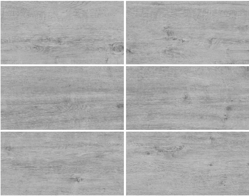
*El color del producto real puede presentar variación al color de la fotografía

CM - Comercial Moderado Productos para ser utilizados en áreas comerciales con tránsito moderado de personas; en áreas de pisos donde no se presenten elementos abrasivos que deterioren la superficie. Se exceptúan locales como: supermercados, bancos, iglesias, hospitales, zonas comunes de centros comerciales y otros similares