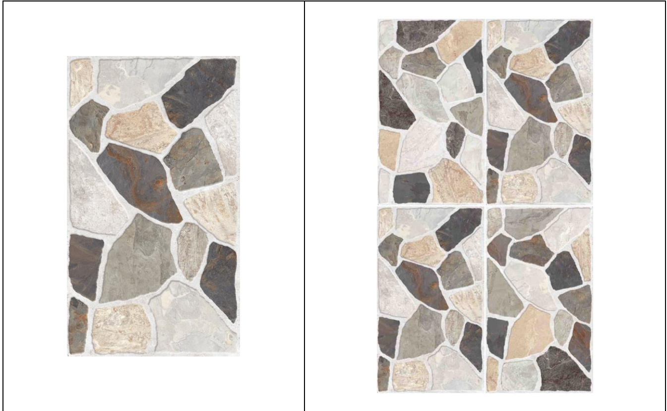
CARAS DEL PRODUCTO