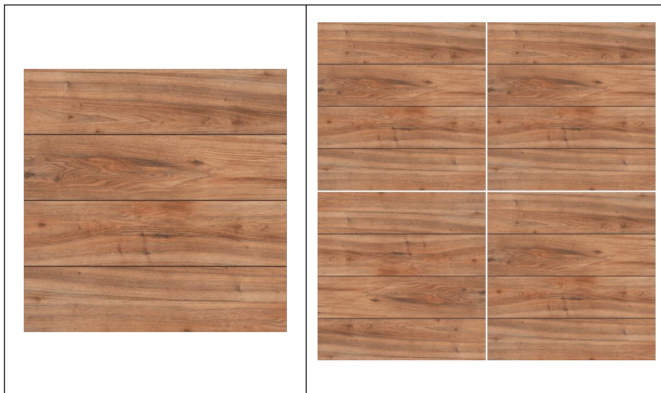
CARAS DEL PRODUCTO